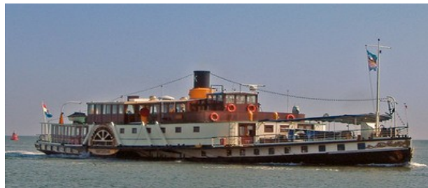
De laatste stoomraderboot de Kapitein Kok

Het lukte om de hulp van een Delfts waterbouwkundige, ir. G.P. Bourguignon, in te roepen. Hij kwam met een eigen ontwerp. De secretaris van de Gelderse coördinatiecommissie voor de dijkverzwaring riep bij de presentatie verrast: “een contra-expertise, dat zien we zelden!”. De coördinatiecommissie gaf de polder opdracht het plan Bourguignon mee te nemen maar een wat geschoffeerd polderdistrict pakte eerst andere dijkvakken aan en liet het plan Bourguignon in de la liggen. Tot de extreem hoge waterstand van 1995. Toen is het alsnog uitgevoerd. Een klein succes is in dit verband ook dat het roestige hek bij Bellevue, met een gat er in door een granaatinslag uit de oorlog, werd teruggeplaatst. Het is de laatste herinnering aan de aanlegplaats van de stoomraderboten die in de 19 e eeuw van Rotterdam op Nijmegen en Keulen voeren.