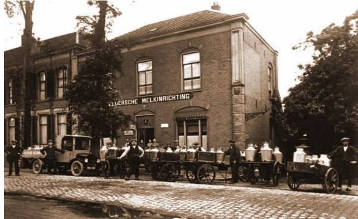
De oude melkfabriek aan de Stationsstraat