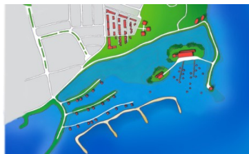
Schetsplannen Kleine Willemspolder

Een pleidooi van de werkgroep om de grenzen van het natuurontwikkelingsproject fort St. Andries bij Tiel te leggen is gehonoreerd. Jammer is het dat de gemeente uiteindelijk de Kleine Willemspolder bij het Betuweterrein er uit liet schrappen omdat men daar meer zag in een drijvende woonwijk. Het laatste plan is om de dijk te verbreden met het argument dat het tegen de kwel van Tiel-Oost helpt, maar dat er er woningen op een dergelijke dijk gebouwd kunnen worden is misschien meer bepalend.. Zo'n dijk wordt ook wel een klimaatdijk genoemd.