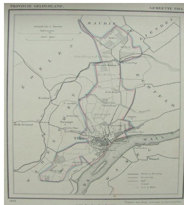
Tiel rond 1860

De keerzijde was dat buitengebied van Tiel gezien werd als bouwterrein. De bouwplannen stapelden zich op, eerst werd de voormalige Tielse polder volgebouwd, Tiel –West verscheen, de Hennepe, Drumpt, Drumpt-Zuid en de Rauwenhof volgden. Uiteindelijk werd ook de sprong over het Inundatiekanaal gemaakt, Passewaaij verrees. Daarover is veel discussie geweest. Het standpunt van de werkgroep was dat de bevolkingsprognoses veel te optimistisch waren. Bovendien is de opvatting dat het benaderen van het buitengebied als een leeg gebied dat volgebouwd kan worden, leidt tot een verlies van natuur- en landschapswaarden. Wat ontbrak in de benadering van de gemeente, was een visie op natuur en landschap. Dat leidt uiteindelijk tot een verlies aan kwaliteit van de leefomgeving. Daarom is er voor gepleit om niet alleen een visie op het bouwen te ontwikkelen maar ook een visie te maken voor de manier waarop je met het landelijk gebied van de gemeente Tiel zou moeten omgaan, daarbij ook te kijken naar het belang van de landbouw. Die discussie is eigenlijk nooit goed op gang gekomen. Sterker nog, er ontstond een gevoel van ruimtenood omdat de grenzen van de gemeente letterlijk genaderd werden. Iets wat ook bij de gemeentelijke herindeling een rol speelde; de omringende gemeenten kozen er nadrukkelijk voor niet bij Tiel te horen. Zoelen ging zo naar Buren, niet naar Tiel.