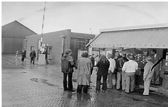
Buurtbewoners vragen om een gesprek met de directie van Verdugt