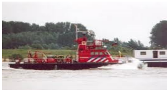
Blusboot de Batouwe in actie

Ook waren er intensieve contacten met de stichting Rheinwasser, die Tiel meerdere malen aandeed, zeker toen er een antieke Zwitserse salonboot als actieschip was aangeschaft. Er werd, met toenmalig gedeputeerde en later minister Hans Alders aan boord een vaartocht naar Nijmegen gemaakt. Toen het schip even stil lag bij de kerncentrale Dodewaard, kwam de bewaking argwanend met verrekijkers naar buiten. ...Later omgedoopt tot stichting Reinwater zijn de opvolgers van Rheinwasser nog steeds actief op het gebied van educatie.